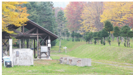
羊蹄山自然公園真狩キャンプ場

真狩村は、羊蹄山の南側に面した人口約 2,000 人の農村です。質の高い食用コリ根が全国一の出荷量を誇っています。旬の農産物が勢揃いする秋の「ほくほく祭り」では、公民館前の広場に集まる村民や観光客に向けて臨時の WiFi スポット開設にポジモが活用されました。どこにでも持ち運びが可能な一体型の移動式機器であること、電源時給型で設置場所にコンセントが不要なことが決め手となり、3 台のポジモを導入しました。現在は、まっぴり温泉の隣に整備されているコテージに 1 台常設され、残りの 2 台を夏の間キャンプ場駐車場に設置し、お客様の通信サービスとして役かっています。今後も自由に持ち運べるポジモの特徴を生かし、様々な野外イベントなど、人の多く集まる場所での WiFi スポットサービスを展開しながら、インバウンド観光などにつなげていきたいと考えています。