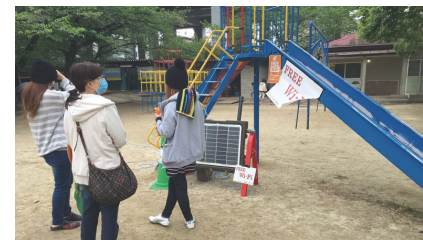
避難所になっていた熊本市内の小学校

株式会社ミライト北海道支店では、災害発生時に通信会社が復旧作業の現場において、ネットワークカメラを活用した中央からの指示で、迅速かつ正確な復旧作業を行えるよう、ポジモとネットワークカメラをパッケージとして提案をし、各地でのデモに対応できるように評価機を保有していました。この提案を全国の支店で共有していたため、熊本地震発生後に同社九州支店が避難所での臨時無料 Wi-Fi SPOT の設置に乗り出しました。北海道から九州へのポジモの移送ののち、熊本市から情報入手し、発災の翌々日に臨時無料 Wi-Fi SPOT を避難所に開設しました。避難所では、被災者のデータ通信量が契約上限に達している方がほとんどで、無料 Wi-Fi の設置に喜んでいました。これにより、災害情報収集、安否確認、子供向けに娯楽などの活用が進み、被災者に安心が広がりました。