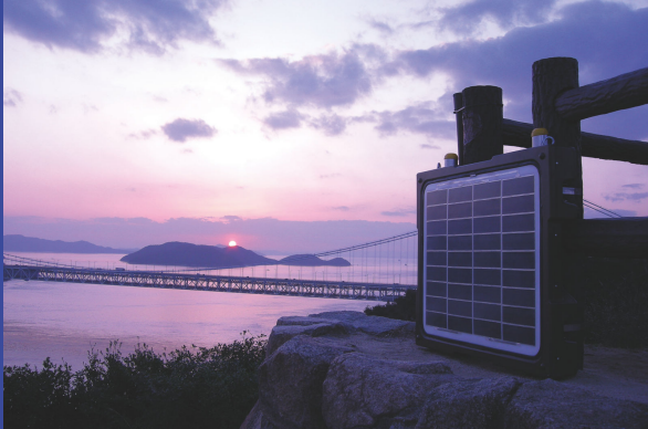
鷗羽山 (瀬戸内海国立公園 / 岡山県倉敷市)